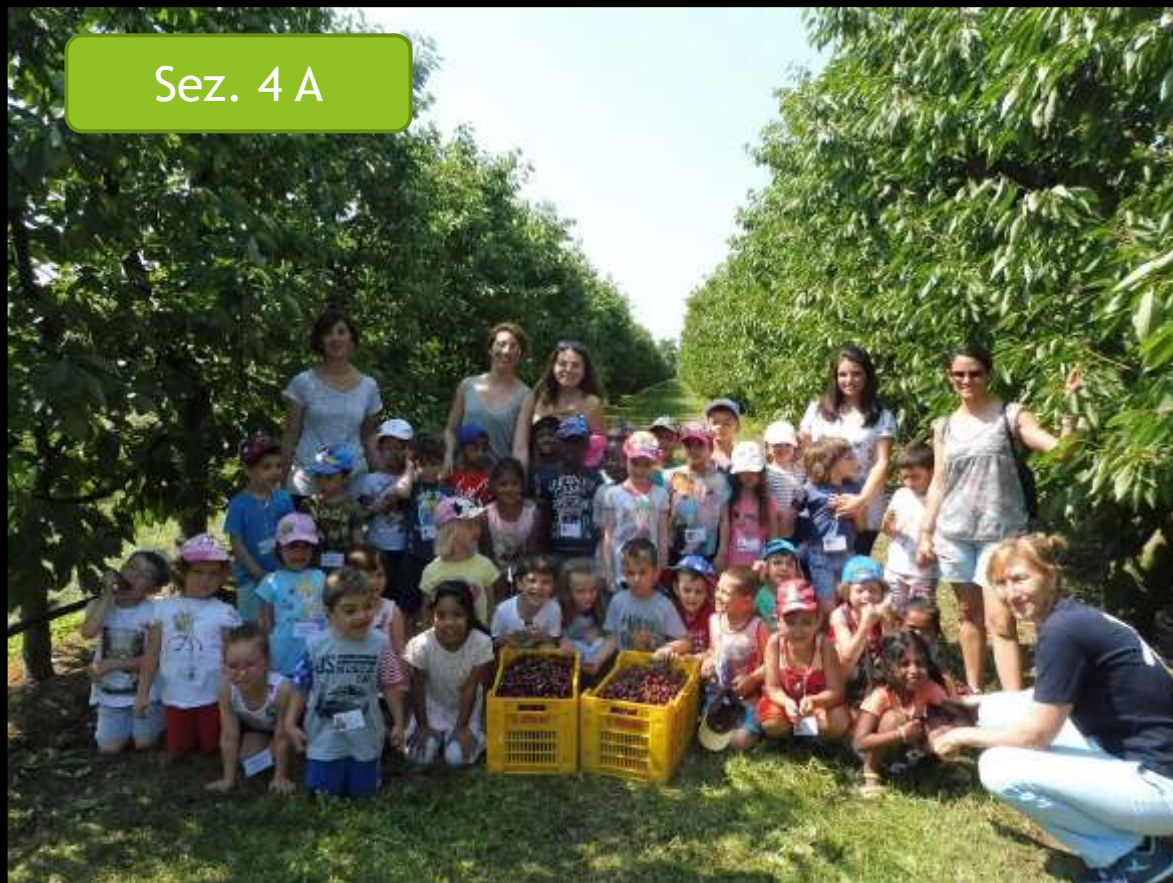
Sez. 4 A

Le varie uscite hanno permesso ai bambini di prendere confidenza con il territorio e la natura.