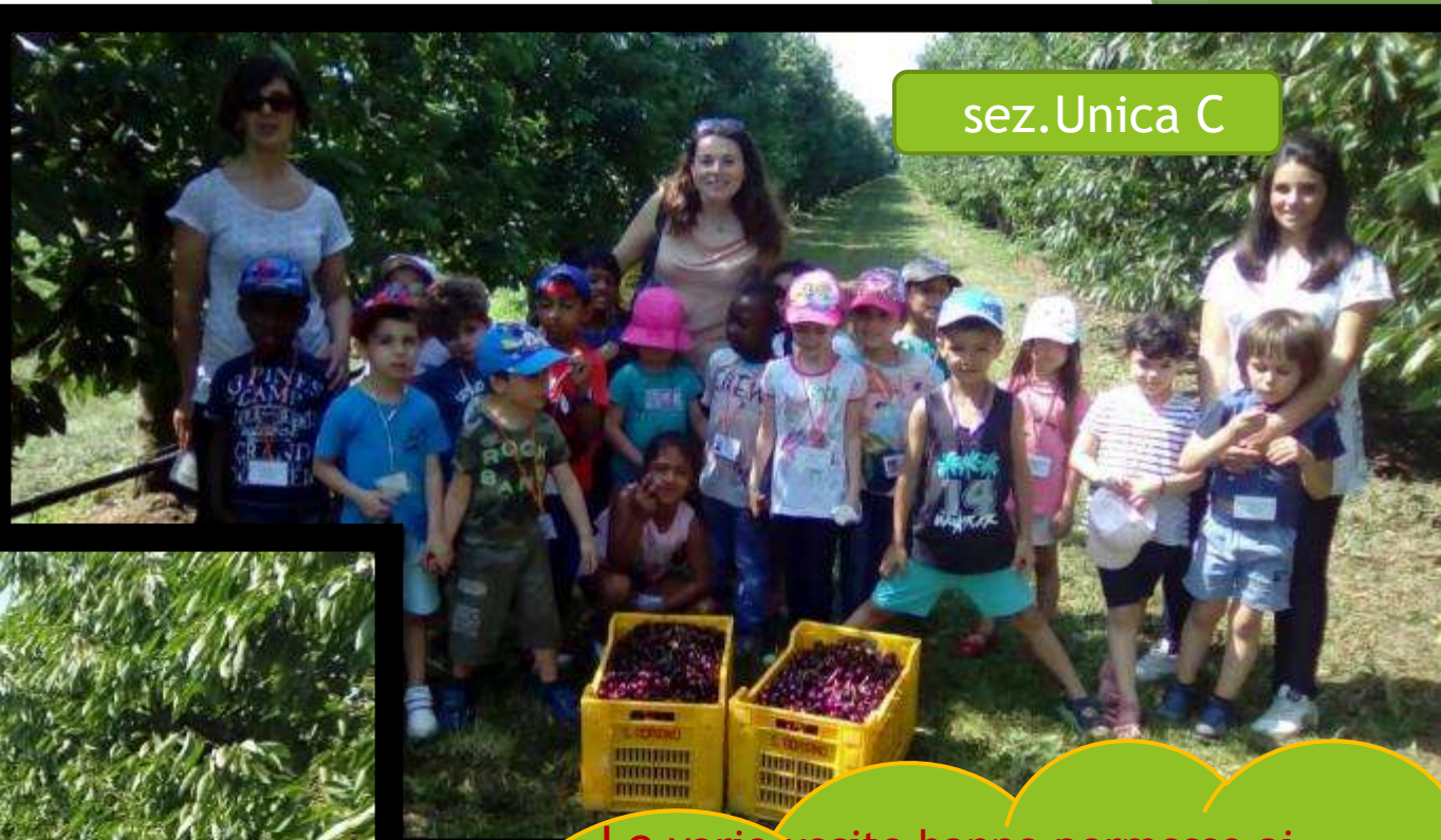
sez. Unica C